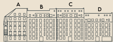
HAUS HEINRICH | HAUS KONRAD